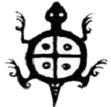
黄 姓 www.100.com